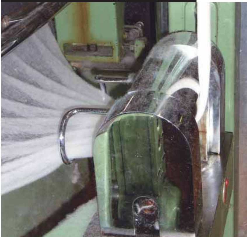
Auf der «Karde» wird ein Baumwollstrang gesponnen

Die Geschichte des Textilindustriellen und Eisenbahnpioniers Adolf Guyer-Zeller wurde zu seinem 100. Todestag im April 1999 zu einer umfassenden Ausstellung aufgearbeitet. In sechs Themenblöcken wird das facettenreiche Leben dieser starken Persönlichkeit aufgezeigt.