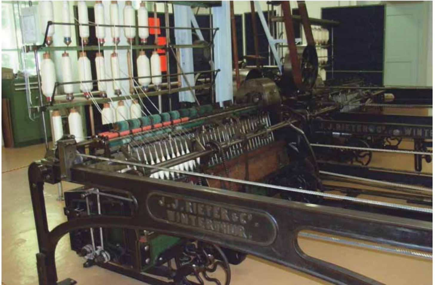
Wagen-Spinnmaschine, auch Selfaktor genannt. Gebaut 1889 bei der Firma J. J. Rieter, Winterthur