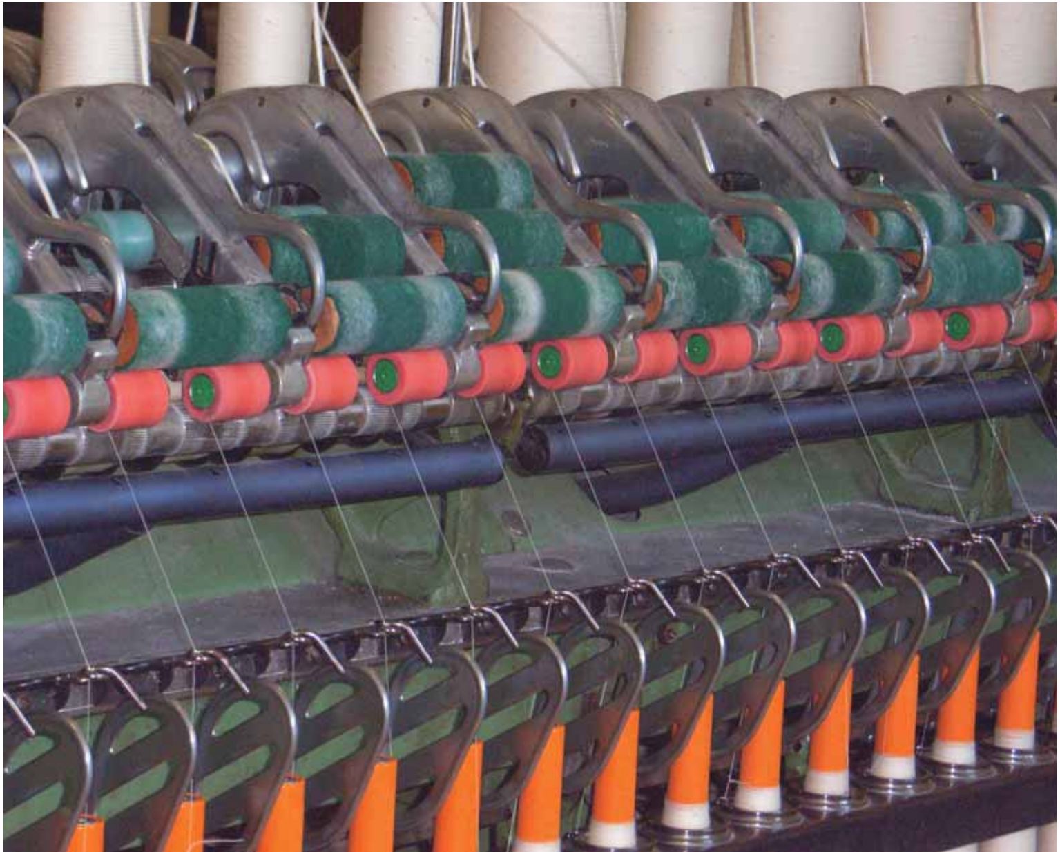
Ringspinmaschine, erbaut in der ersten Hälfte des letzten Jahrhunderts